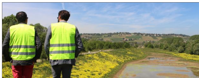
■ Voisine d'Ancycla, la carrière de Plattard accueille 120 000 tonnes de terre par an. Elles contribuent à la reconstruction écologique du site.

Ces peintures murales, inspirées par l'univers de la BD, illustreront l'activité de l'entreprise et seront aussi un moyen de dissuader les tagueurs.